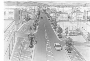
中央通り線完成予想図

元号が令和へと代わった今年、2年目を迎えた中心市街地活性化事業も、さまざまな分野で事業が順調に進んでおります。