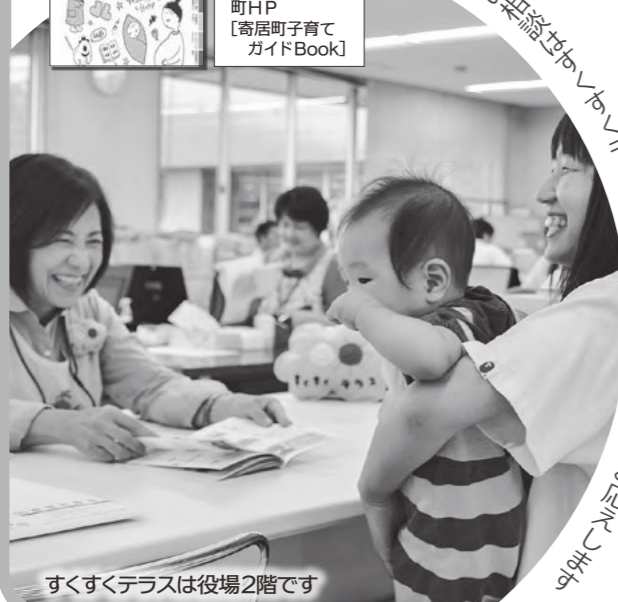
すすすくテラスは役場2階です