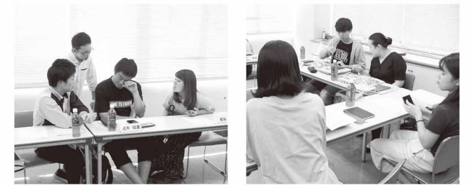
「皆さんの心に残る成人式にしたい」 打ち合わせを重ねる委員の皆さん