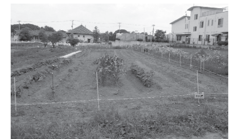
☎ 農林課 ☎ 581-2121内線403・407

地上約30cmに通電線を設置し、その下にプラスチックネットを張り巡らせることで、より効果的にイノシシやアライグマ、ハクビシンなどの侵入を防ぐことができます。農作業用の出入口を設置することも可能です。折原地内のは場で、農業実践講座の際にこの方法で電気柵を設置したところ、受講生から「動物から農作物を守ることができた」「思ったよりも簡単に設置できた」と好評でした。