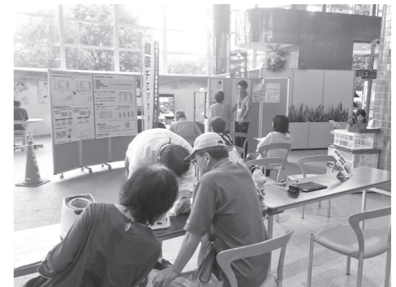
☎ 町民課 ☎ 581-2121内線113~115

町 では、6月から毎月第4金曜日を「健康チェックの日」として、庁舎1階ロビーに脳血管疾患予防健康チェックコーナーを設けています。寄居町は、県内で脳血管疾患による死亡率が高い傾向にありますが、生活習慣を改善することで、脳血管疾患を予防できる可能性が高くなります。今月の健康チェックの日は、 8月23日午前9時から正午まで です。月に一度の健康チェックを習慣にして、脳血管疾患の予防にぜひご活用ください。