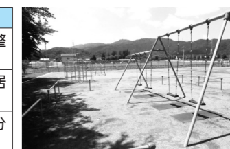
寄居運動公園内の遊具（都市公園維持管理事業）