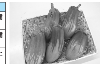
商標登録した「寄居とろとろナス」（特産品開発支援事業）