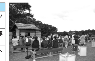
お月見の会の様子（鉢形城歴史館運営事業）