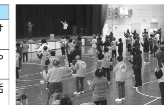
ラジオ体操講習会の様子（健康づくり推進事業）