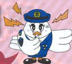
埼玉県警察マスコット 「ポガ美ちゃん」