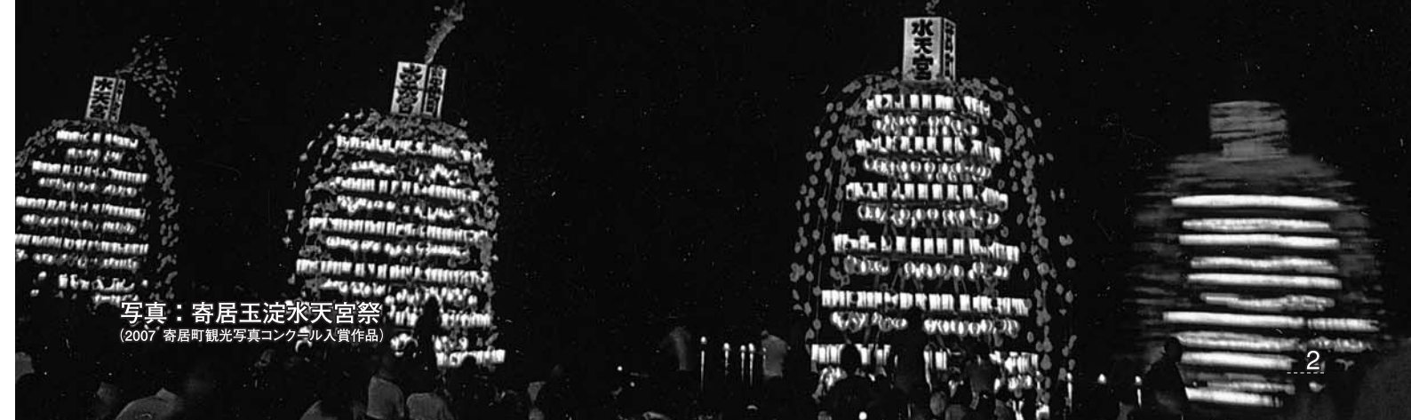
写真：寄居玉淀水天宮祭 (2007 寄居町観光写真コンクール入賞作品)

今年も暑い夏がやってきます。 夏まつり、水天宮祭、いかだ下り。 いずれも“よりの夏”の風物詩です。 昨年からは、エキナセア祭も加わり、ますます充実した よりの夏を楽しみましょう！