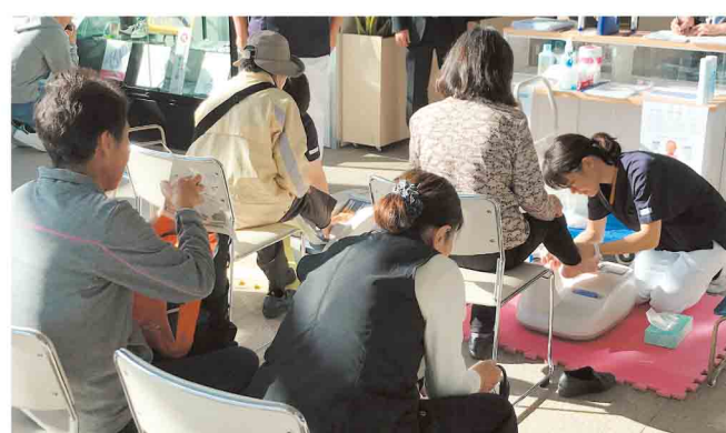
骨密度測定の様子

11月11日に、役場庁舎1階で健康まつりを開催しました。寄居薬剤師会、埼玉よりい病院にご協力をいただき、体脂肪や血管年齢測定などの健康チェック、お薬相談や特定健診PRコーナーのほか、骨密度測定を実施しました。骨密度を測定した方は「昨年に比べて骨密度が減りませんでした。毎日歩いている効果が確認できてうれしかったです」と話してくれました。