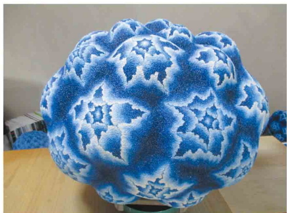
工芸美術部門 中市後さん作品「躍動」

江城畫裏の如く 山暁に 晴空を望めば 雨 水 明鏡を夾み 双橋 彩虹を落す 人烟に 橘袖寒く 秋色に 梧桐老ゆ 誰か念わん 北樓の上 風に臨みて 謝公を懐わんとは