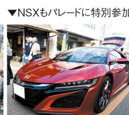
▼NSXもパレードに特別参加