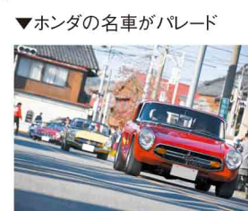
▼ホンダの名車がパレード