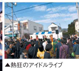
▲熱狂のアイドルライブ