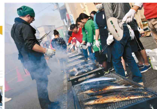
▲秋のチャリティー募金サンマ祭り