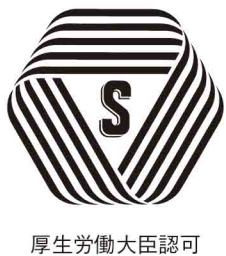
厚生労働大臣認可

標準営業約款制度は、法律で定められた消費者(利用者)擁護に資するための制度です。厚生労働大臣認可の約款に従って営業することを登録した「理容店」「美容店」「クリーニング店」「めん類飲食店」「一般飲食店」では、店頭でSマークを掲げています。登録店は、安心・安全・衛生が保証されていますので、お店選びの目安にしてください。