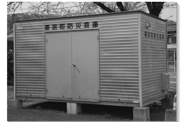
総合体育館・アタゴ記念館敷地内に設置されている「寄居町防災倉庫」

第4編「災害復旧・復興計画」では、復興計画」では、被災者の生活再建、義援金の配布、地域経済の復旧支援等の民生安定のための措置や、公共施設の復旧・復興計画、激甚災害の指定手続き等について明確にしました。 資料編では、町防災会議条例をはじめ、災害時における市町村相互応援協定や各種物資の供給協定等のほか、地すべり危険地区や土砂災害警戒区域等の指