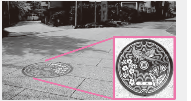
ご存じですか 町のあちこちで見られるマンホールの蓋(ふた)。デザインは町の花・木・鳥です。

Point 男衾駅西側及び県環境整備センターの区域を拡大し、公営企業会計への移行に取り組む。