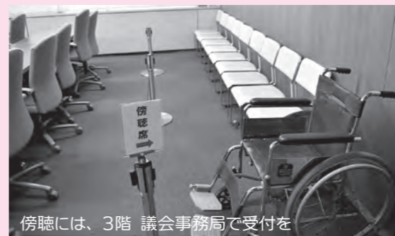
傍聴には、3階 議会事務局で受付を

町議会委員会条例と町議会傍聴規則の一部改正 平成29年7月施行の議会基本条例では「常任委員会及び特別委員会を原則公開」と規定しています。委員会の傍聴にも適用で