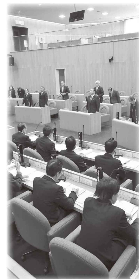
▲モニターを設置し、傍聴しやすくなった議場

町議会第4回定例会（12月議会）が、12月5日から21日までの17日間の会期で開かれ、14件の議案審議が行われました。