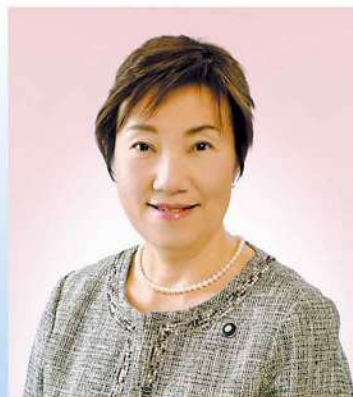
新年のごあいさつ 寄居町議会議長