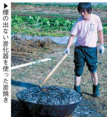
煙の出ない炭化器を使った炭焼き