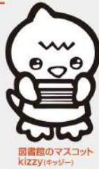
図書館のマスコット Kizzy(キジジー)

開館時間／火～土曜日 9:30～19:00 日曜日、祝日 9:30～18:00 場所／寄居1296-1 問い合わせ／図書館 ☎580・1888