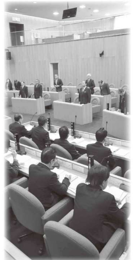
▲モニターを設置し、傍聴しやすくなった議場

町議会第4回定例会（12月議会）が、12月5日から21日までの17日間の会期で開かれ、14件の議案審議が行われました。