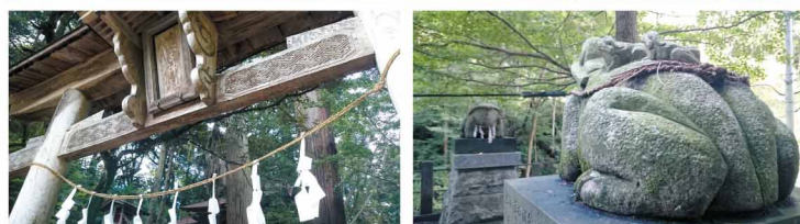
▲鳥居からも歴史を感じます。