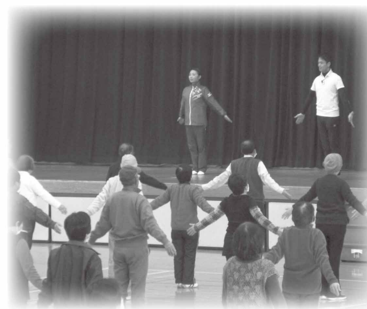
▲昨年度実施したポイント対象事業「ラジオ体操教室」の様子

— 健康で けんこう 幸せな未来のために、あなたも今日から けんこう 健幸貯金! —