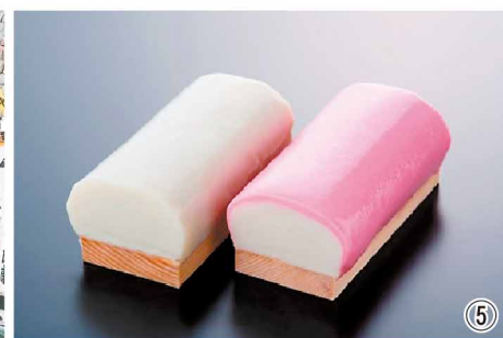
①小田原城②北條早雲公像③小田原提灯④小田原北條五代祭り⑤小田原名物蒲鉾

姉妹都市とは？ 姉妹都市とは、自然環境や歴史等の共通項や、市民レベルでの交流がきっかけとなり、自治体同士で締結するものです。寄居町にとっては、今回が初めての姉妹都市盟約の締結となります。