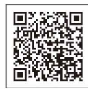
美しい日本 小田原 [このころの絆が育んだ城下町 小田原]篇

■面積 113.81平方キロメートル ■人口 193,389人 (平成28年8月1日現在)