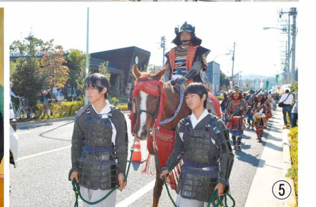
①甲州街道②八王子まつり③清滝駅④車人形⑤元八王子北條氏照まつり