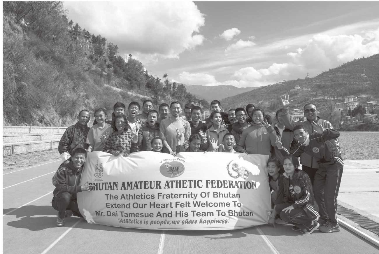
▲為末大氏とブータンの陸上選手たち

■男衾駅周辺地区整備事業 (779,940千円) 男衾駅自由通路の年内竣工を目指すとともに、駅前広場など周辺地区の整備を推進します。