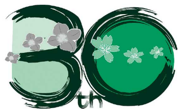
▲日・ブータン外交関係樹立30周年記念行事公式ロゴマーク

2016年は、日本とブータン王国との間での外交関係30周年に当たります。本事業は、外務省による「日・ブータン外交関係樹立30周年記念事業」に認定されています。