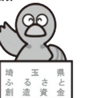
埼玉県マスコット「コバタン」