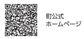
町公式ホームページ

お知らせ 12月1日は世界エイズデーです！ 「世界エイズデー」は、エイズのまん延防止と患者・感染者に対する差別・偏見の解消を目的に制定されました。エイズとは、HIV(ヒト免疫不全ウイルス)の感染により免疫力が低下して、本来なら自分の力で抑えることのできる病気(日和見感染)など、さまざまな症状がた状態をいいます。 早期発見・早期治療が大切です 現在は、さまざまな治療薬が出ており、きちんと服薬することでエイズ発症を予防することが可能になっています。熊谷保健所では、匿名・無料・予約制で検査ができます。 ▶検査日時等 種類 検査項目 日 受付時間 即日検査 HIV 11月9日、12月14日、令和6年1月11日、2月8日、3月14日(各木曜日) 13:30～14:30 通常検査 HIV 梅毒 B型肝炎 C型肝炎 クラミジア 11月28日、12月26日、令和6年1月23日、2月27日、3月26日(各火曜日) 10:00～11:00 ▶費用/無料 ▶検査結果について/即日検査 採血の約1時間後 通常検査 検査日から約10日後 事前、熊谷保健所・保健予防推進担当(☎523・2811)へお申し込みください。