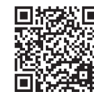
カローリングについて