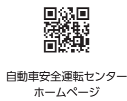
自動車安全運転センター ホームページ