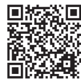
町公式ホームページ