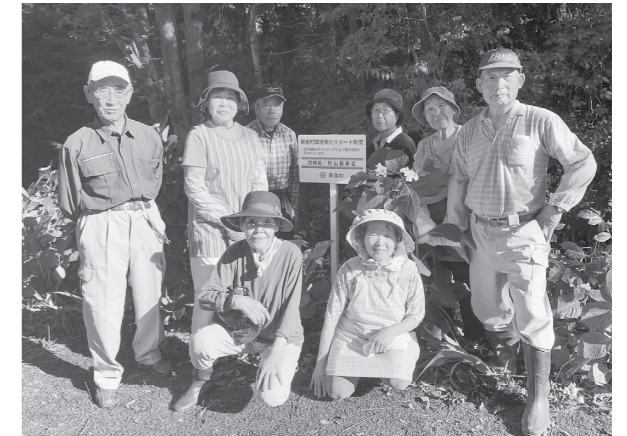
秋山長寿会による植栽活動

町では、道路、公園、河川等の公共空間の環境美化を促進するため「環境美化サポート制度」による美化活動を実施しています。この制度は、町とボランティアの個人や団体が協力して、町道等の公共施設の環境美化活動を行い、きれいな公共空間の創出を図ることを目的としており、活動していただく個人や団体を随時募集しています。