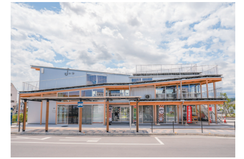
寄居駅南口徒歩1分。

寄居駅南口駅前に4月にオープンしたYotteco。複合施設としてさまざまな用途にご活用いただけます。皆さん、気軽にお立ち寄りください。