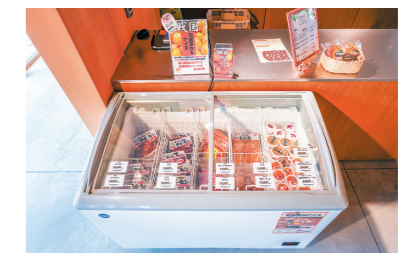
寄居駅南口駅前拠点施設