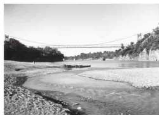
玉淀河原と正喜橋