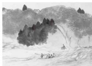
横山大観筆 (部分) (大正4年、榎ヤマタネ所蔵)