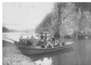
玉淀の船遊び (昭和8年、中島紳介氏所蔵)