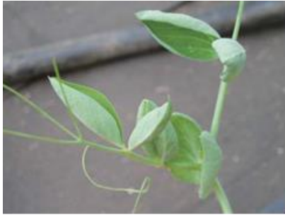
品目：さやえんどう 症状：葉がカップ状になる