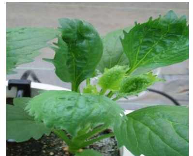
品目：アスター 症状：葉の異常