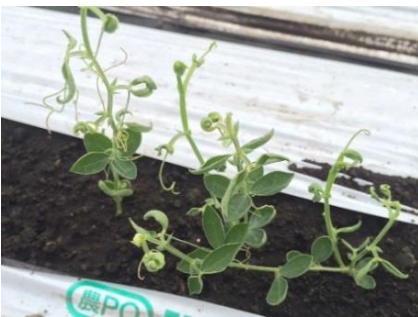
品目：スイートピー 症状：葉の異常