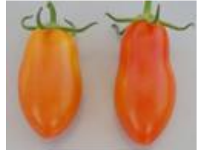
品目：ミニトマト 症状：果実が細長く変形