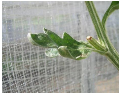
品目：きく 症状：葉の異常