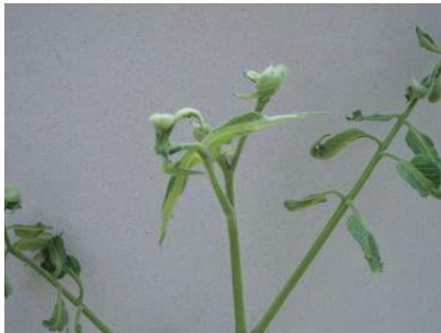
品目：トマト 症状：葉の異常