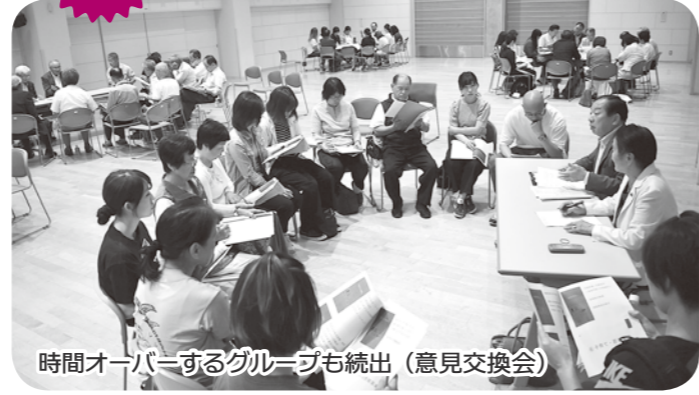
時間オーバーするグループも続出(意見交換会)