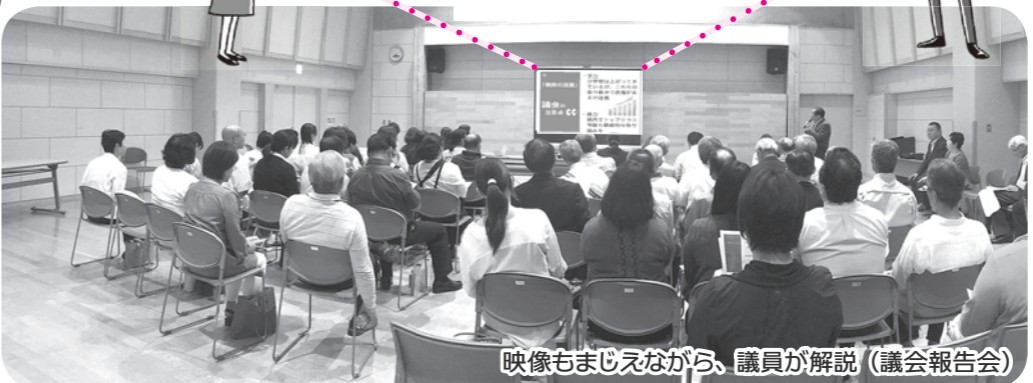
映像もまじえながら、議員が解説(議会報告会)

県北一体で 県と協力して、企業立地に結びつくようなインフラ整備を他市町村とともに行うべきだと思います。県北という単位での雇用創出を考え、若者の定住を目指してください。